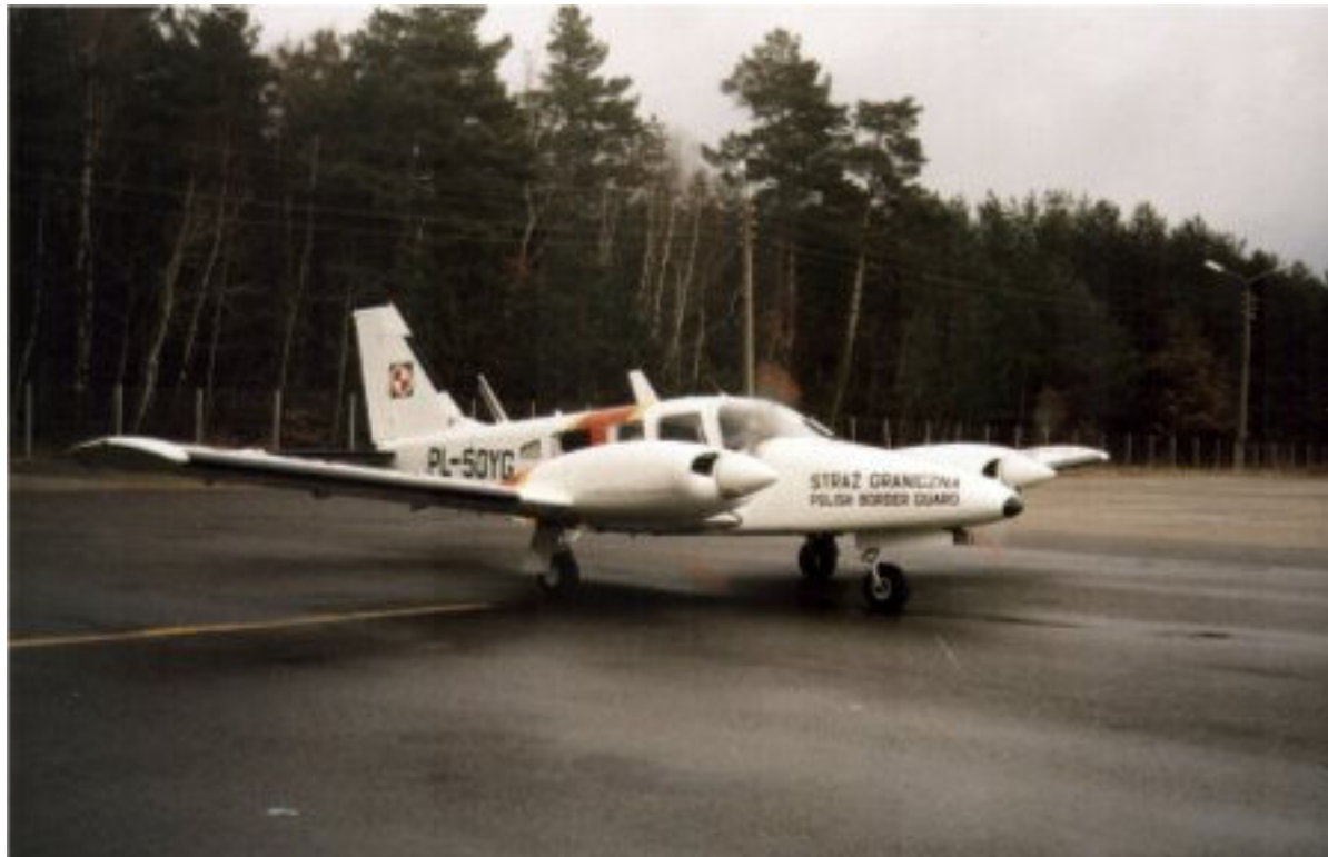
Fot. 1. Samolot patrolowy MOSG PZL M-20 Mewa

Samolot PZL M-20 Mewa jest licencyjną odmianą amerykańskiego samolotu dyspozycyjnego Piper PA-34 „Seneca II”. Prototyp samolotu Piper „Seneca” został oblatany w 1971r. Zmodyfikowana odmiana oznaczona „Seneca II” powstała w 1975 r.