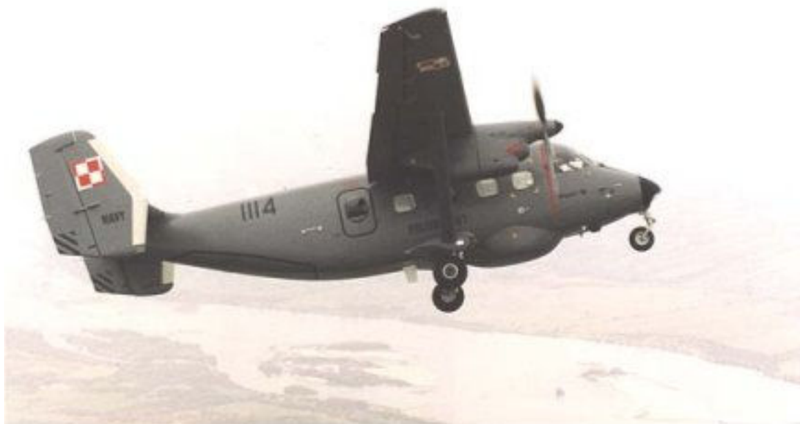
Fot. 2. Samolot M-28 Bryza

M-28 Bryza jest górnopłatem zastrzałowym z nieciśnieniowaną kabiną, podwójnym usterzeniem pionowym, stałym podwoziem trójkołowym zamocowanym do kadłuba ze sterowanym przednim kołem.