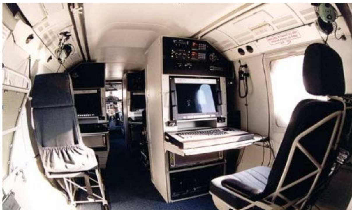
Fot. 3. Wnętrze samolotu M-28 Bryza

Stosowane w samolocie M-28 silniki zapewniają dużą nadwyżkę mocy, dzięki czemu samolot dysponuje doskonałymi osiąganiami i zapewnia duże bezpieczeństwo użytkowania w locie. Dodatkowo układ dwusilnikowy, zgodnie z obowiązującymi przepisami, umożliwia wykonywanie lotów nad wodą. Dodatkowo sprawność zastosowanych jednostek napędowych umożliwia lot z jednym pracującym silnikiem na pułapie przekraczającym 3000 m.